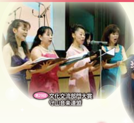
第29回 文化交流部門大賞 守山音楽連盟

地道に地域貢献活動を続けておられる人たちの、ほのぼのとした無償の行いを顕彰します。